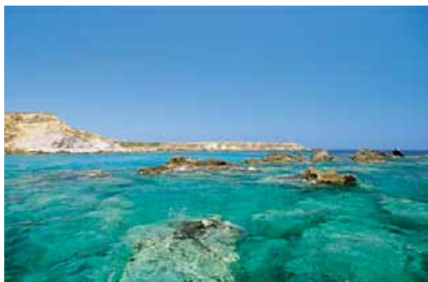
La riserva marina di Isola Capo Rizzuto