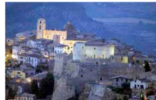
Il castello e la cattedrale di Santa Severina