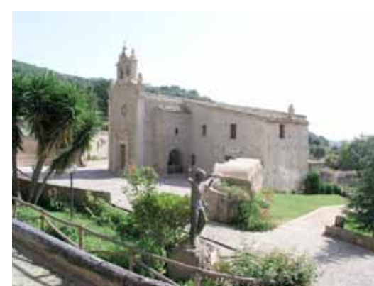
Il Santuario di Belvedere di Spinello