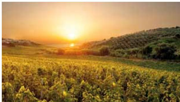
Le vigne del paese di Cirò