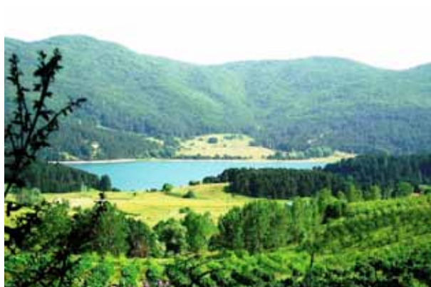
Il villaggio di Trepidò nella Sila