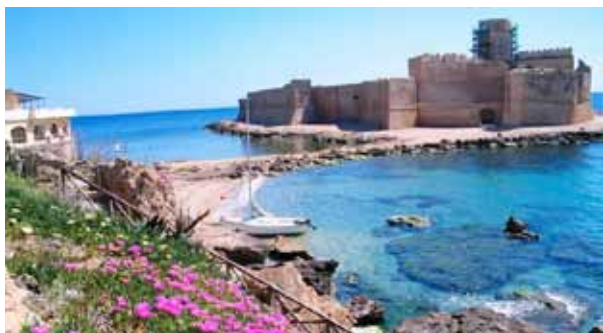
Il Castello Aragonese di Le Castella