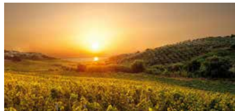
Le vigne di Cirò

Comune della provincia di Crotone noto per le proprie attività artigianali, fra cui l'arte dei tessuti e quella del vimini finalizzata alla realizzazione di pregevoli cesti. Oggi è maggiormente conosciuto per il borgo antico e come località balneare, oltre che per la produzioni eno-gastronomiche.