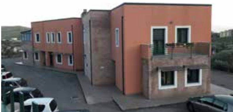
Fondazione Città Solidale - Catanzaro

La Fondazione Città Solidale Onlus è nata per portare a compimento i progetti della Caritas diocesana di Catanzaro e per promuovere nuovi servizi, sempre nell'ottica dell'attenzione alla persona in difficoltà e della condivisione cristiana del disagio sociale.