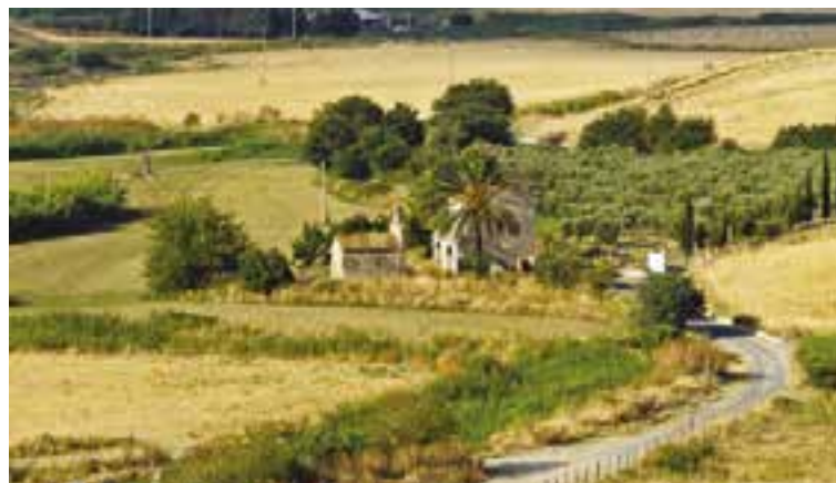
Masseria De Tursi - Strongoli

La Fondazione Città Solidale Onlus è nata per portare a compimento i progetti della Caritas diocesana di Catanzaro e per promuovere nuovi servizi, sempre nell'ottica dell'attenzione alla persona in difficoltà e della condivisione cristiana del disagio sociale.