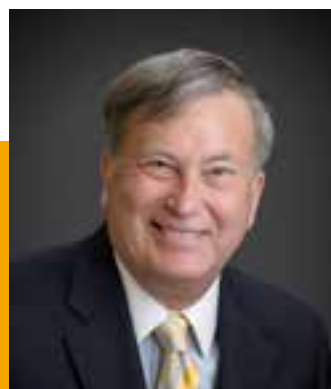
Charles Zech, Preside di facoltà della Villanova University

L'organizzazione di Tutoring prevede un coordinatore generale e supervisore dei processi e altri tutor ai quali sono affidati i singoli corsisti in modo da poter realizzare un servizio più personalizzato e per meglio intercettare i diversi codici culturali ed i personali stili di apprendimento, oltre alle diverse esigenze di analisi e di approfondimento.