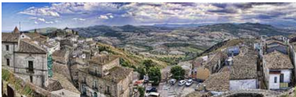
Il Comune di Crucoli

La Masseria De Tursi è sita in località "Murgie di Strongoli" uno dei più interessanti e suggestivi SIC (Sito di importanza Comunitaria) della provincia di Crotone, dove ancora oggi la tradizione si coniuga con piani e progetti di sviluppo sostenibili.